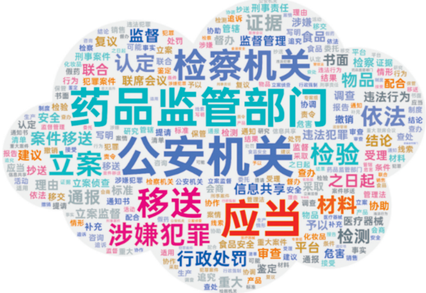
图1 药品行刑衔接政策文本词云图

本研究采用微词云平台绘制词云图,并选取词频排名前100的特征词进行可视化(图1)。“药品监管部门”“公安机关”“检察机关”等关键词较为突出,显示执法主体在药品行刑衔接中的关键性。相比之下,“检察机关”的词频低于前两者,因其职能侧重于对衔接过程的监督,而非直接参与案件移送与立案等实质环节。药品监管部门与公安机关在机制运行中处于主导地位,分别承担“移送”与“立案”两大关键环节。此外,“涉嫌犯罪”“检验”“认定”等高频词也指向机制中需重点规范和优化的事项。词云中“行政处罚”的凸显,提示了反向衔接在行政责任追究中的重要性。“应当”作为典型模态词,虽已在现行法律规范中广泛替代“必须”来使用,以提升条文适用的灵活性,但相对较低的刚性会导致法律规范存在被弱化的可能性,因此更需加强对执行的追踪与监督。