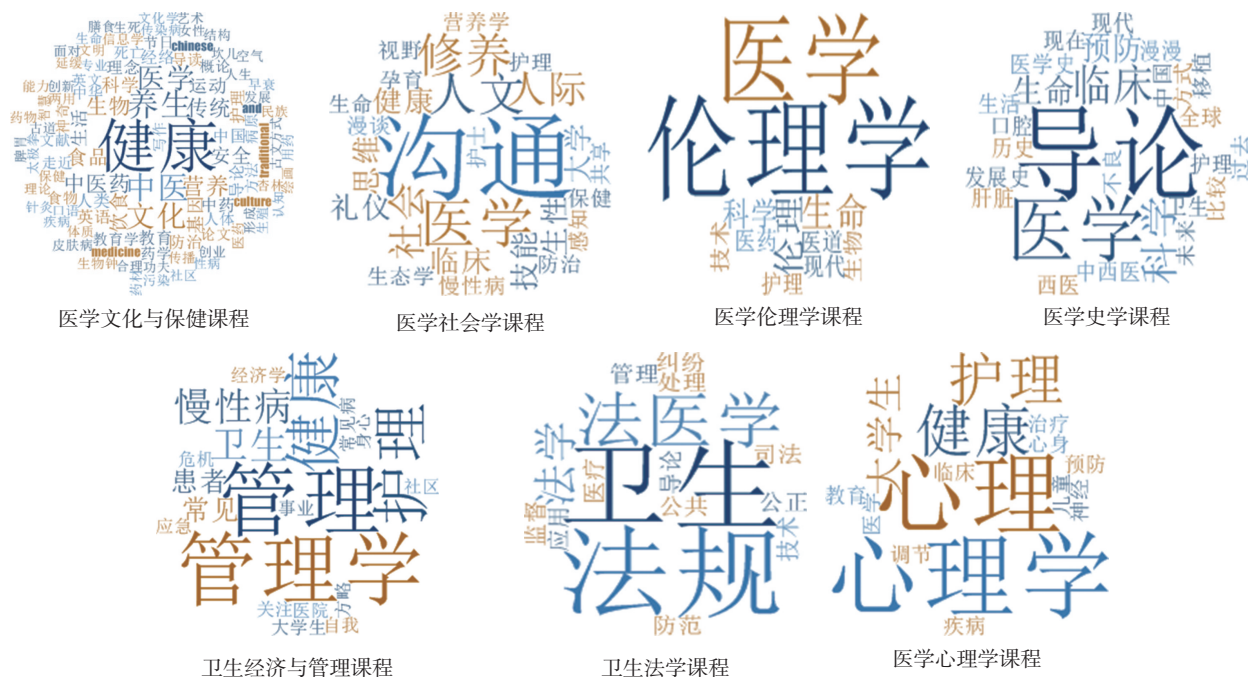
图2 医学人文慕课课程名称词频